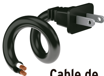
Cable de uso rudo